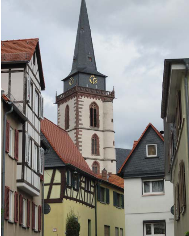
Kirche St. Ursula